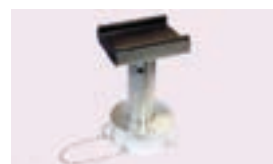
Adaptador de altura para U de 150-233 mm