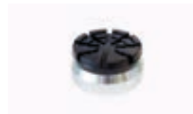
Adaptador de altura 44 mm