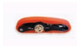
Cintas de sujeción (2 unidades)