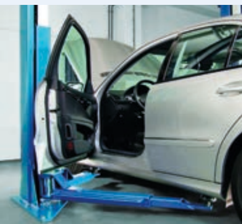
Amplia apertura de las puertas delanteras del vehículo