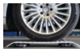
Rampas entrada (4 unidades)