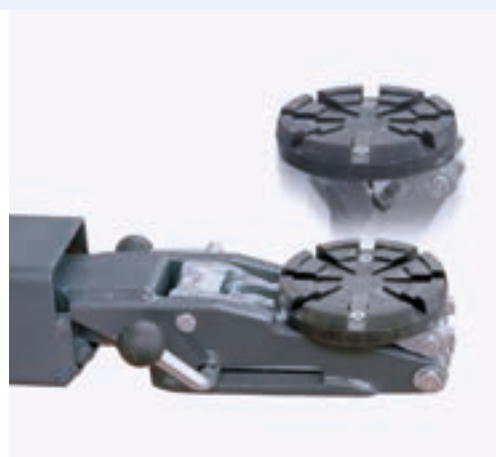
Brazos Mini-Max: Ideal para levantar vehículos SUV y autos bajos con faldones.