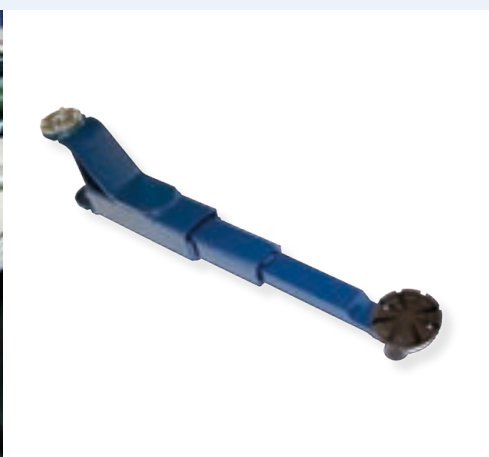
Brazos de 3 etapas