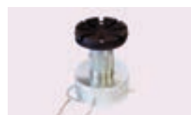
Adaptador de altura 155-245 mm